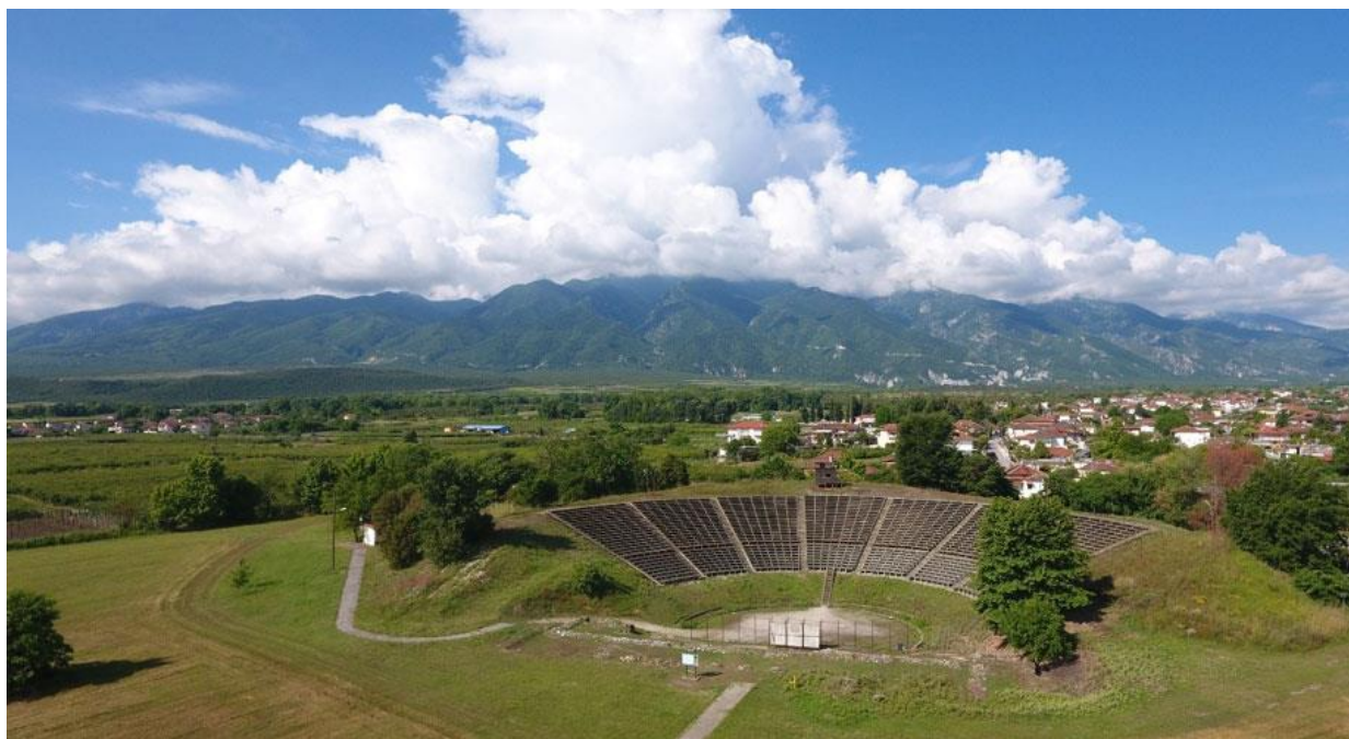
Το ελληνιστικό θέατρο του Δίου, πίσω του το σύγχρονο χωριό του Δίου και στο βάθος ο Όλυμπος.

Βρείτε εδώ κείμενα και εικόνες για να περιηγηθείτε ευχάριστα και δημιουργικά! Παίξτε με δράσεις στο Φύλλο Εργασίας και συμπληρώστε τη Φόρμα Αξιολόγησης !