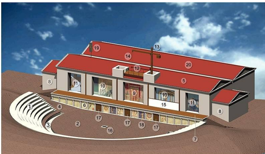
Αναπαράσταση του ελληνιστικού θεάτρου του Δίου.

Ελληνιστικό θέατρο (No1): Μπορείτε να ξεκινήσετε την περιήγησή σας προχωρώντας από την είσοδο του αρχαιολογικού χώρου προς το ελληνιστικό θέατρο που ανακαλύφθηκε. Εδώ διαμορφώθηκε με τη μεταφορά χώματος ένας τεχνητός λοφίσκος, ώστε να δημιουργηθεί το κοίλο του θεάτρου, ο χώρος για τους θεατές. Στην κυκλική ορχήστρα, με διάμετρο περίπου 26 μ., και μάλιστα στο κέντρο της ξεχωρίζει η λεγόμενη «χαρώνεια κλίμακα» των αρχαίων. Ήταν ένας υπόγειος διάδρομος από τον οποίο εμφανίζονταν στην ορχήστρα οι ηθοποιοί που υποδύονταν πρόσωπα του Κάτω Κόσμου. Ο κυρίως χώρος των ηθοποιών, των υποκριτών, ήταν το οικοδόμημα της σκηνής, αναπαράσταση του οποίου μπορείτε να δείτε στην εικόνα και παρακάτω. Τα κατάλοιπα του θεάτρου αυτού χρονολογούνται στον 4 ο αι. π.Χ., ενώ στην ίδια θέση πιθανόν υπήρχε παλιότερο θέατρο όπου ίσως παίχτηκαν οι τραγωδίες του μεγάλου ποιητή της αρχαιότητας Ευριπίδη, τις οποίες είχε γράψει κατά την παραμονή του στη Μακεδονία. Στο θέατρο αυτό μέχρι σήμερα γίνονται παραστάσεις και εκδηλώσεις το καλοκαίρι στο Φεστιβάλ Ολύμπου .