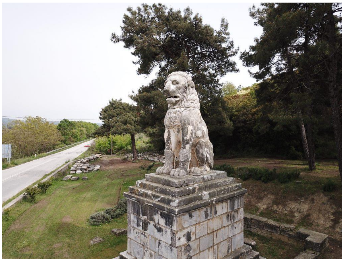
Ο Λέων της Αμφίπολης πάνω στην επαρχιακή οδό Αμφίπολης - Σερραϊκής Ακτής.

Βρείτε εδώ κείμενα και εικόνες για να περιηγηθείτε ευχάριστα και δημιουργικά! Παίξτε με δράσεις στο Φύλλο Εργασίας και συμπληρώστε τη Φόρμα Αξιολόγησης !