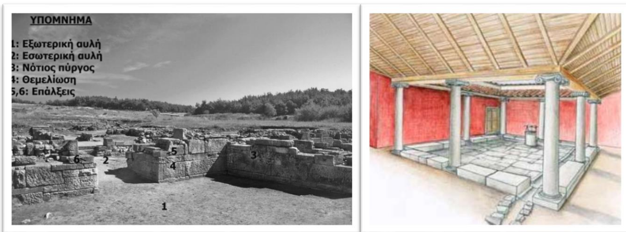
Τα ερείπια του τείχους, η αναπαράσταση του σπιτιού του 4 ου αι.π.Χ. και το ψηφιδωτό των δελφινιών.

Μπορείτε να συμμετέχετε στην αξιολόγηση του εκπαιδευτικού περιεχομένου (διάρκειας 5-10 λεπτών) για τη συγκέντρωση των δικών σας σχολίων και προτάσεων.